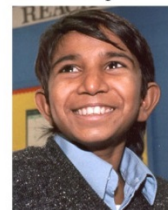
Iqbal Masih bevrijdde kindsclaven