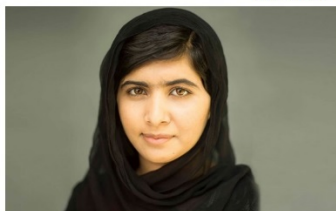
Malala Yousafzai strijdt voor het recht op onderwijs voor meisjes