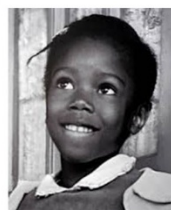
Ruby Bridges trotseerde racisme op haar school