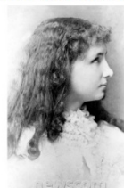
Hellen Keller inspireerde vele doven en blinden