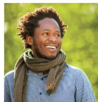
Ishmael Beah probeert meer kindsoldaten te voorkomen