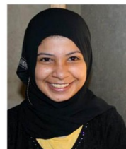
Nujood Ali vroeg op haar tiende echtscheiding aan