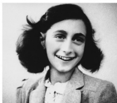
Anne Frank schreef haar wereldberoemde dagboek over een kind in oorlogstijd